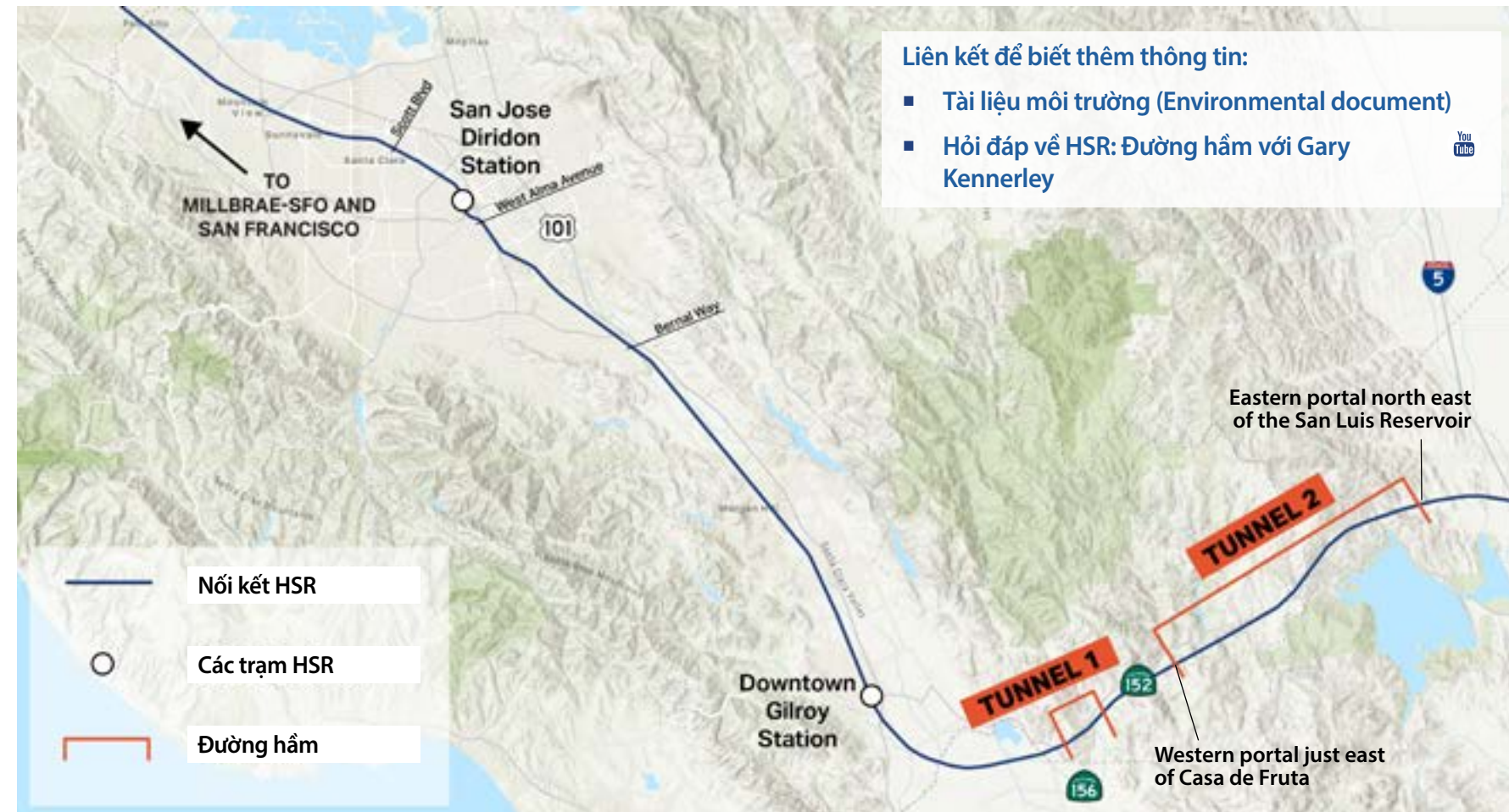
Hình 3. Bản đồ cho thấy vị trí của Đường hầm 1 ở phía đông Gilroy và Đường hầm 2 xuyên qua Đèo Pacheco.