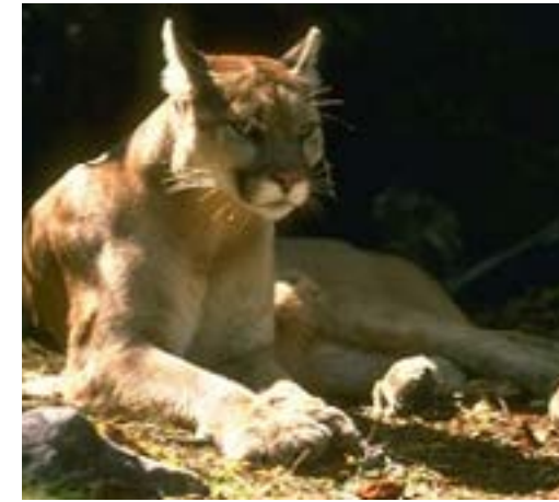
Hình 5. Báo sư tử và nai sừng tấm tule elk là hai trong số nhiều loài sống ở khu vực Đèo Pacheco.

Khi xây đường hầm cho các phần của đường sắt cao tốc dưới lòng đất, trên mặt đất sẽ vẫn tương tự như tình trạng thiên nhiên ngày nay và giữ được các hành lang di chuyển và môi trường sống của động vật hoang dã có từ trước đến nay trong khu vực Đèo Pacheco (như báo sư tử và nai sừng tấm tule elk trong Hình 5).