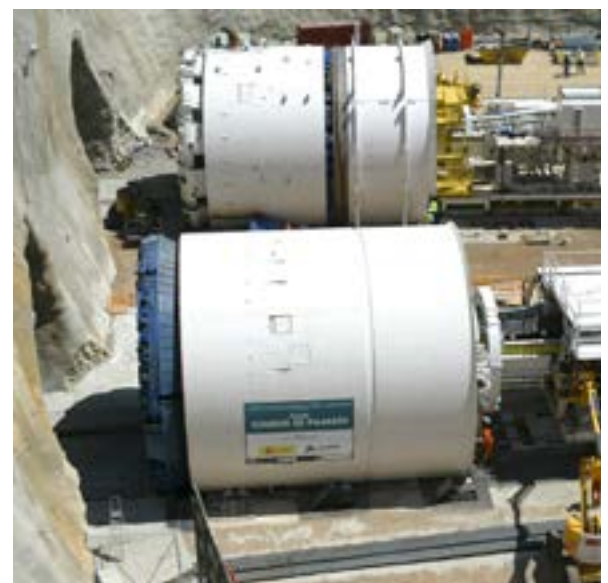
Hình 2. Hình ảnh máy khoan hầm đang khoan hầm có hai lối.

Các thí dụ trên thế giới, gồm Nhật Bản và Trung Quốc, nơi có 14 trong số 20 đường hầm đường sắt dài nhất thế giới; Vương quốc Anh, nơi có dự án HS2 nối London và Scotland gồm các đoạn đường hầm dài; và Thụy Sĩ, Ý và Áo, nơi đường hầm dành cho đường sắt cao tốc nối các thành phố và quốc gia nằm ở hai bên rặng Alps.