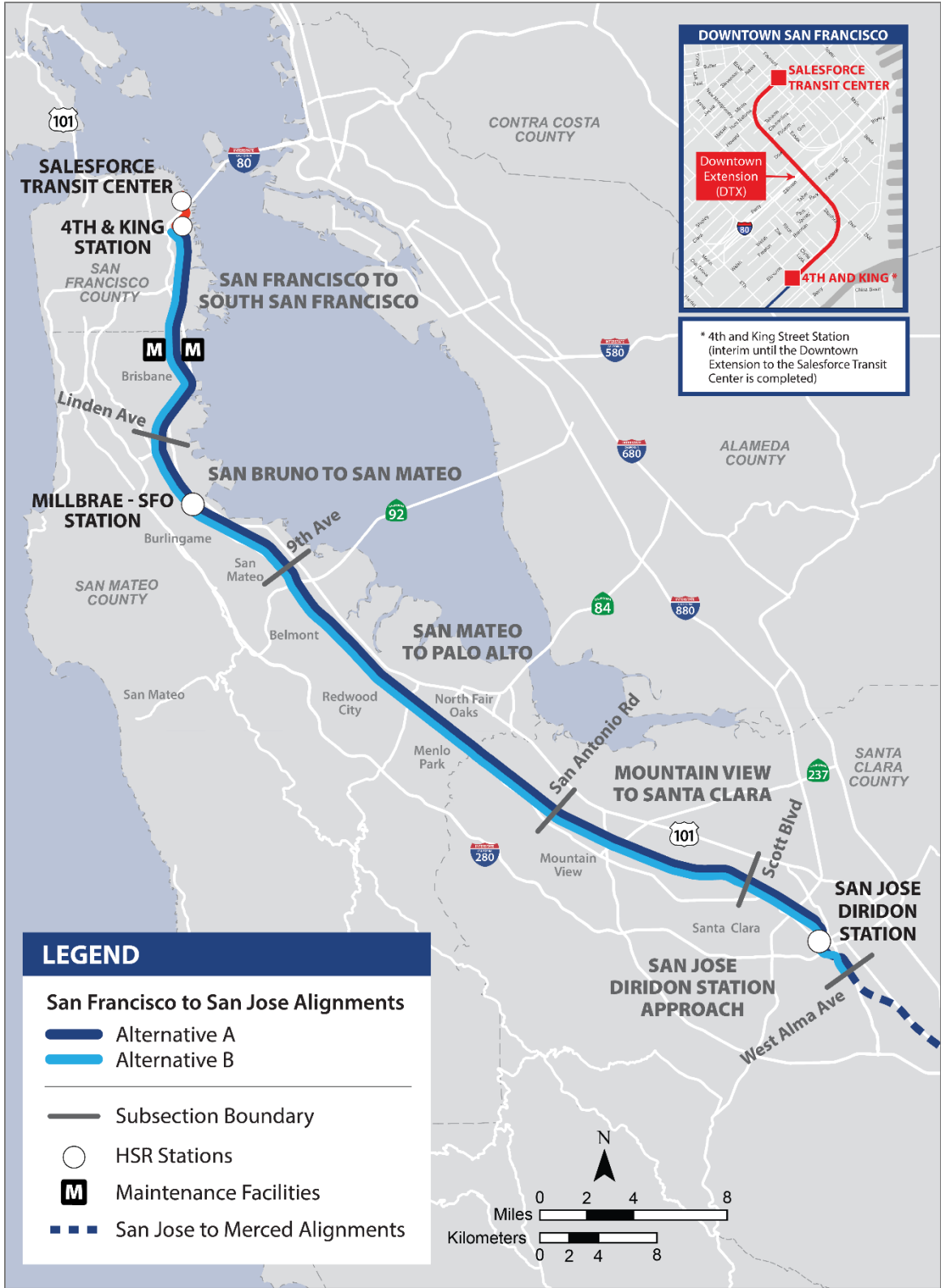
Hình S-2 Phần Dự Án Từ San Francisco đến San Jose